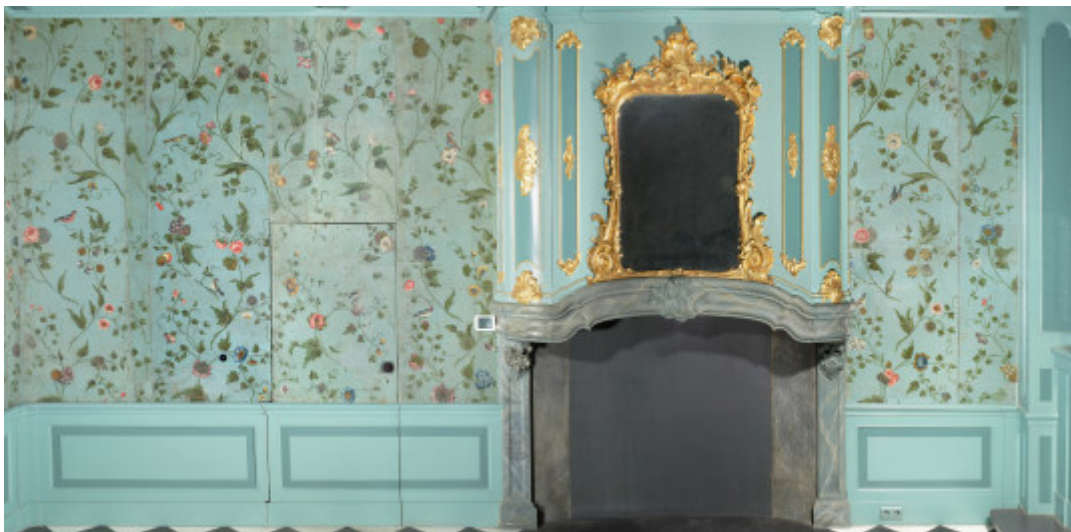
Spiegelkamer Oude Kerk na restauratie.

Op 14 februari, de dag waarop de liefde wordt gevierd, gaat na een uitgebreide restauratie van het historische behang, de Spiegelkamer in de Oude Kerk in Amsterdam weer open. Deze stijkamer diende eerst als sacristie en was daarna lang de plek waar de ‘commissarissen van huwelijkszaken’ kantoor hielden. De liefde werd er bezegeld door een handtekening en een contract. Een van de beroemdste in de Spiegelkamer ondertekende documenten is de ondertrouwakte van Rembrandt van Rijn en Saskia van Uylenburgh (10 juni 1634).